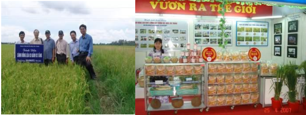
Lúa Basmati đột biến đã được trồng trên 1000ha tại Đồng bằng Sông Cửu Long