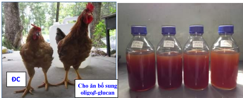
Ứng dụng chế phẩm oligo \beta -glucan trong chăn nuôi gà sạch chất lượng cao