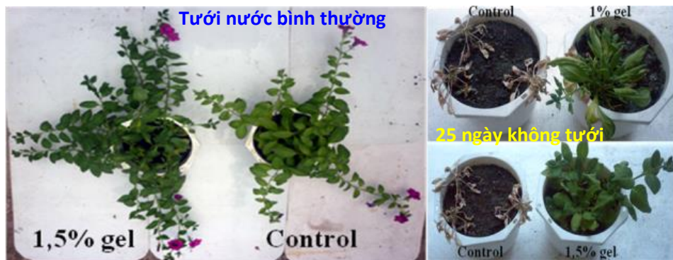
Ứng dụng chế phẩm hydrogel cố định dinh dưỡng ứng dụng trong trồng hoa kiểng