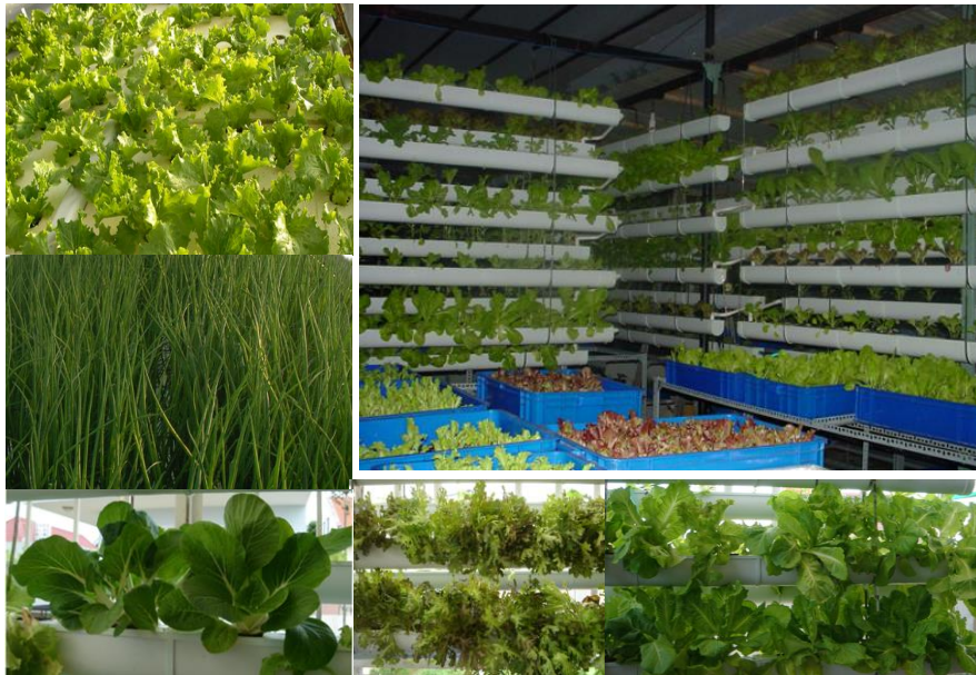
Ứng dụng chế phẩm oligosaccharide trong sản xuất rau sạch chất lượng cao