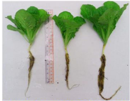
Cải tào sau 14 ngày trồng trên đất sạch (trái); trên xơ dừa & phân đã xử lý không gel (giữa) và trên xơ dừa & phân có bổ sung 1% gel (phải).

Ứng dụng chế phẩm hydrogel trong xử lý chất thải gia súc để sản xuất phân bón sinh học đa năng